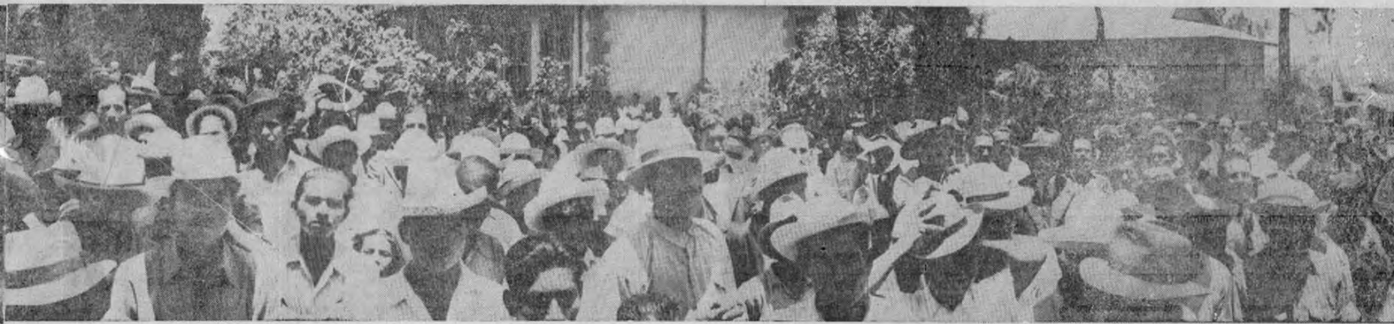
Ha sido esa la más grandiosa reunión que registra la historia política

REGO PARA TESTIMONIAR SU SIMPATIA AL PROXIMO PRESIDENTE DE COSTA RICA