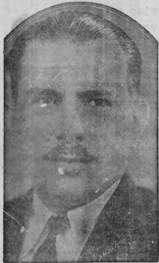
LICENCIADO DON TEODORO PICADO M.