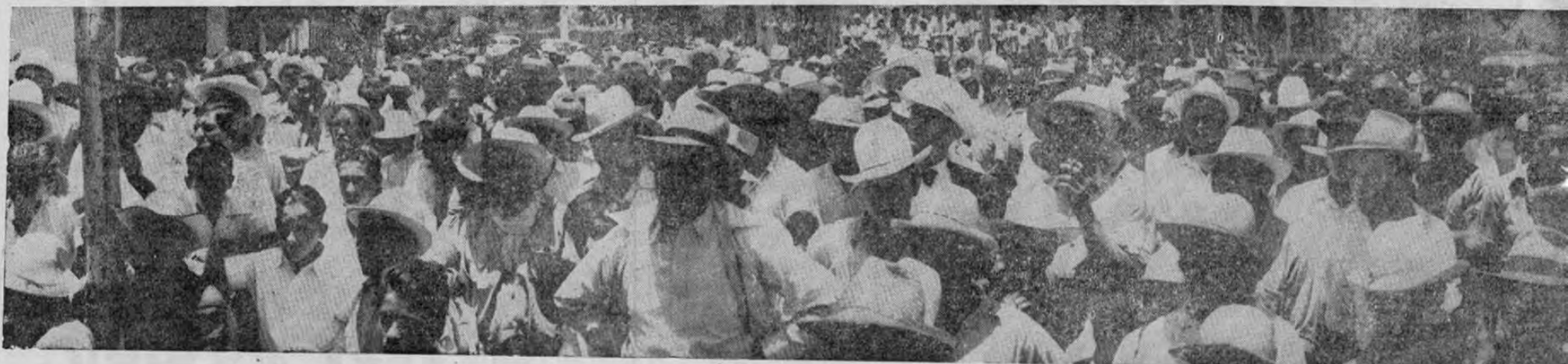
Las gráficas dicen más que las palabras y aquí están las gráficas de esa magnífica reunión,

Ha sido esa la más grandiosa reunión que registra la historia política